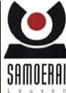
Helm en wapenuitrusting van Oda Nobunaga